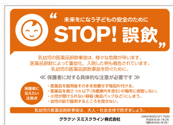
乳幼児誤飲防止包装 指導箋