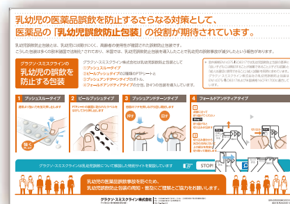
乳幼児誤飲防止包装 説明用下敷き