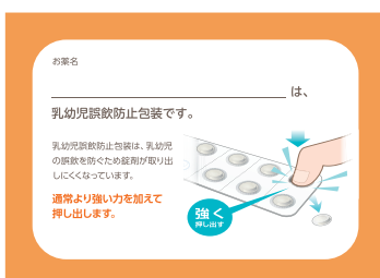
乳幼児誤飲防止包装 指導箋

https://gskpro.com/ja-jp/resource/guidance-for-patients/ の疾患/包装からご利用いただけます。