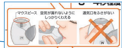
説明文「マウスピース(吸入口)全体をくわえ」を「マウスピース(吸入口)全体をしっかりとくわえ」と変更し、上のイラストを追加いたします。